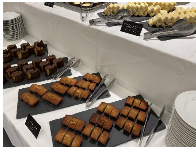
洋菓子店の商品アピール