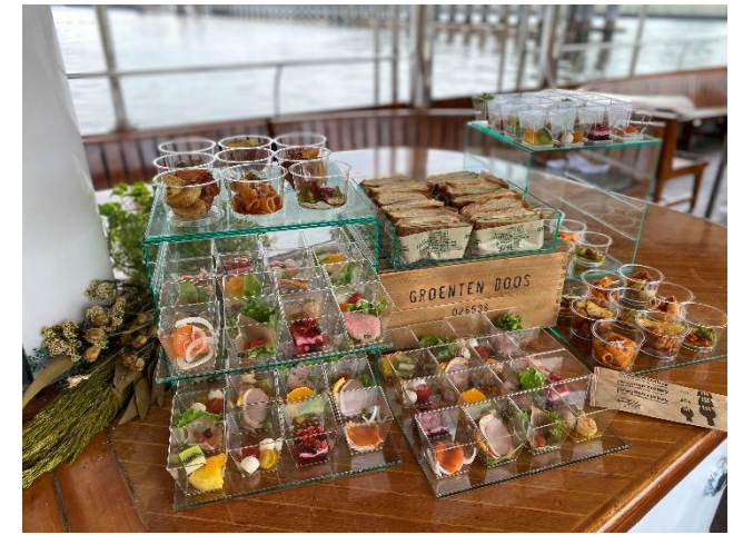
弊社新料理のお披露目及び紹介