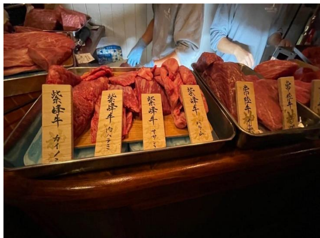
国産牛の商品案内アピール